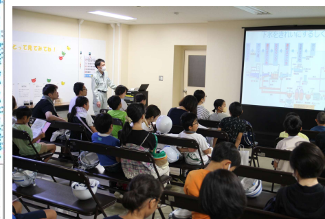
夏休み子ども教室

上下水道事業のさらなる理解向上を図るため、 今後、広報・広聴を充実し、多角的な情報発信などを実施